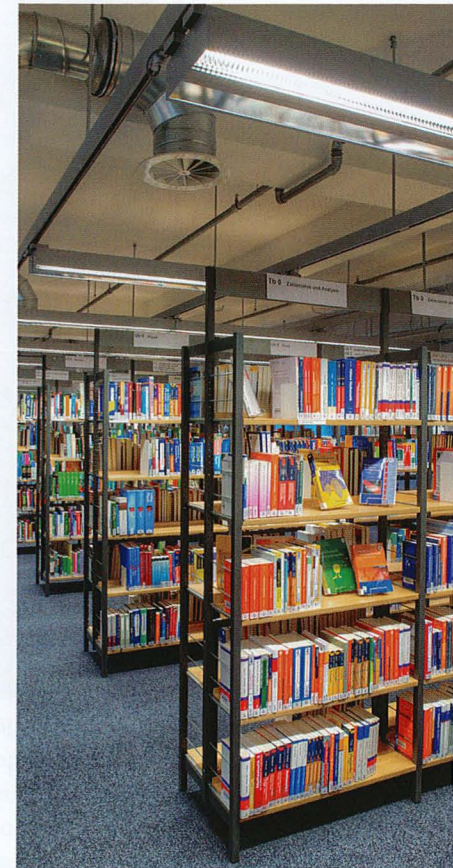
Bücherhalle Hamburg – Bestandsbeleuchtung der Zentralbibliothek. Ausgezeichnet mit dem „Deutschen Lichtdesign-Preis 2013“, Kategorie „Bildung“.

In Zeiten der nahezu perfekten „Rendering-Qualitäten“ und VR-Präsentationen (Virtuelle Räume ...) spricht dies für die Optimierung von Licht-Raum-Situationen auch und besonders über Modellversuche, um die zahlreichen, nie exakt beschreibbaren Wirkungen „live“ erleben und diskutieren zu können.